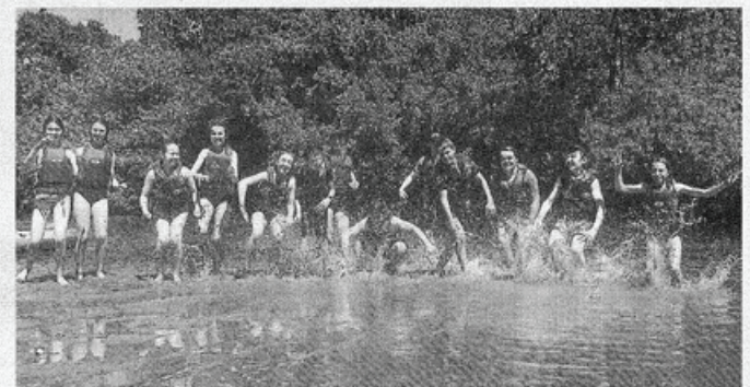
L'été 2017 s'annonce diversifié et rafraîchissant pour les jeunes du territoire.

Pour le lancement de l'été, l'équipe jeunesse invite tous les jeunes à participer à la première édition de la Bar-