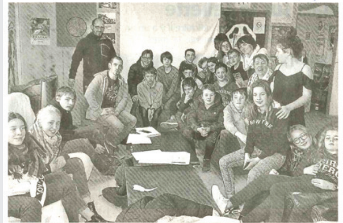
C'est dans la joie, mais avec un travail sérieux, que tous ces jeunes se sont penchés sur les activités de l'été.