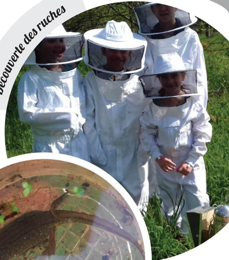
Découverte des ruches