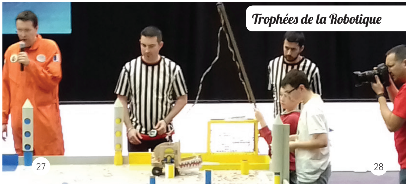
Trophées de la Robotique