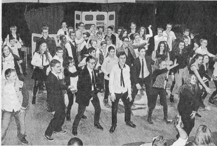
Une belle aventure pour les jeunes du territoire qui, pour leur investissement, se verront mis à l'honneur au cours d'une soirée d'exception.

Pour certains, il s'agira d'une première fois, comme le chantier bac de Loire réalisé en partenariat avec la commune de Savennières. Ou le