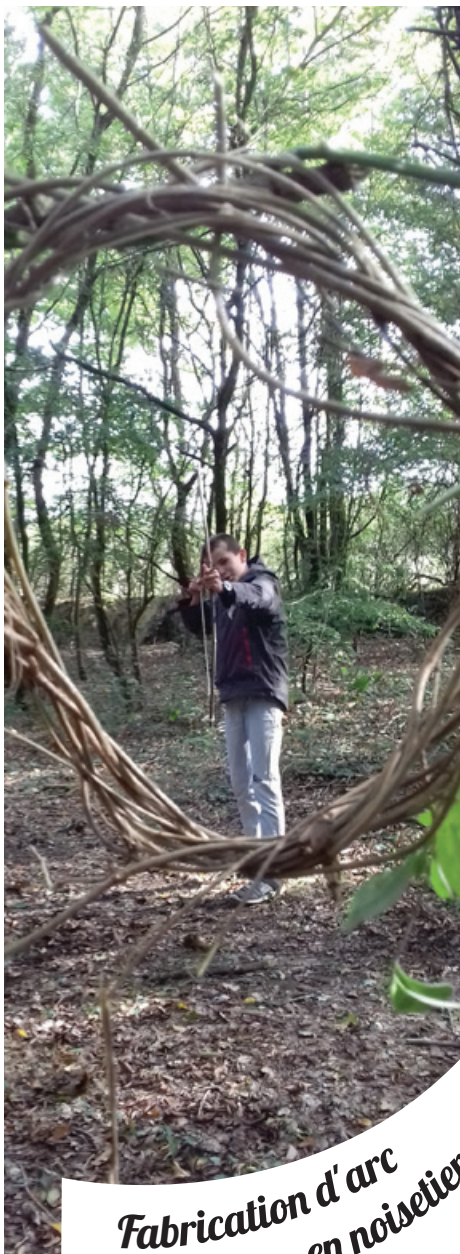
Fabrication d'arc en noisetier