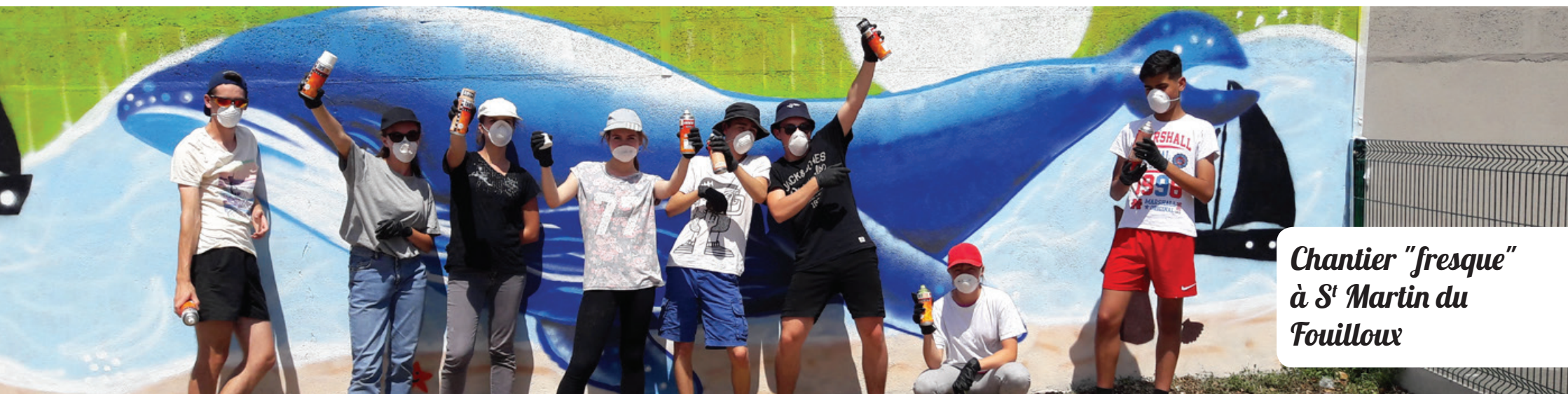
Chantier "fresque" à St Martin du Fouilloux