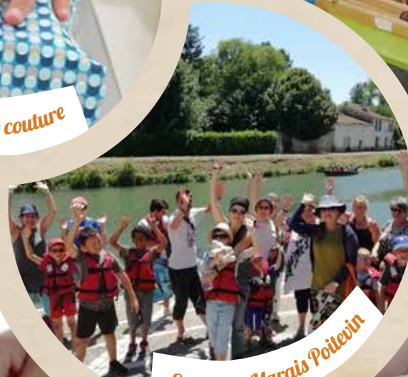
Sortie au Marais Poitevin