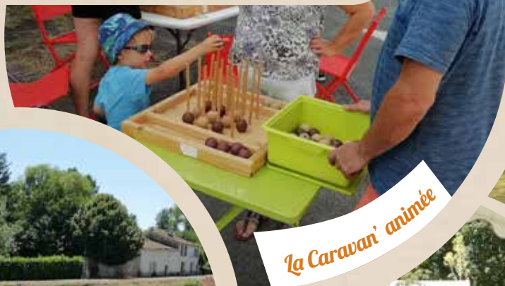
La Caravan' animée