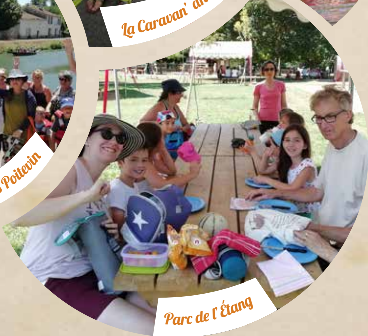
Parc de l'Étang