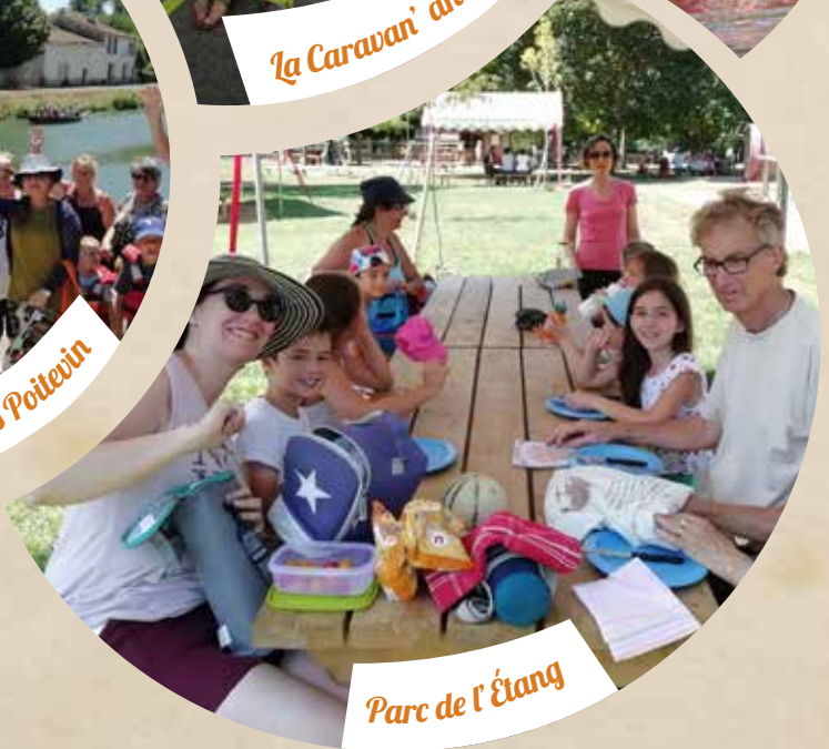
Parc de l'Étang