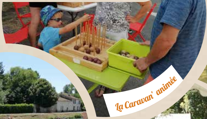
La Caravan' animée