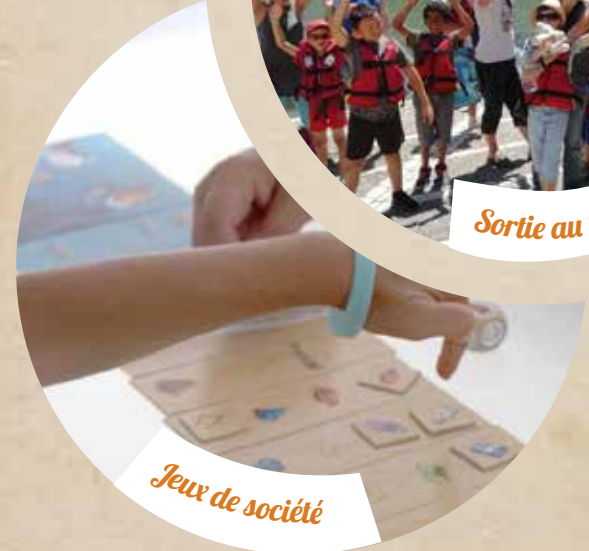
Jeux de société