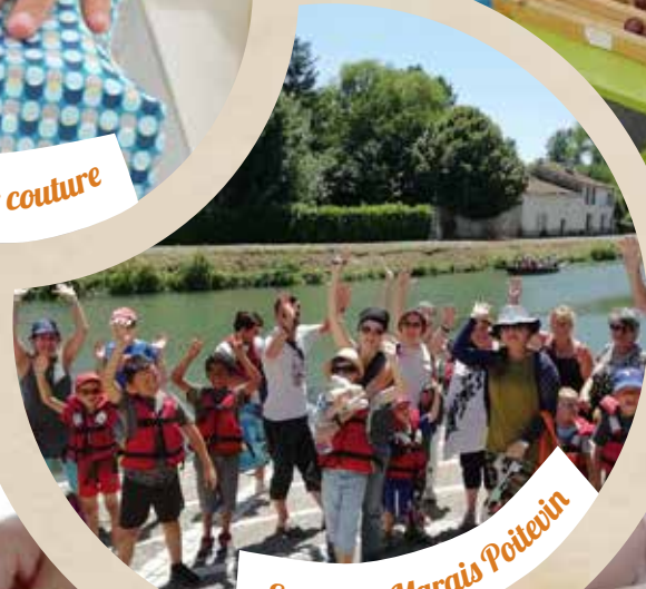
Sortie au Marais Poitevin